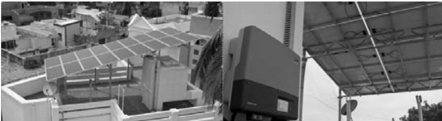
Photo de l'installation solaire photovoltaïque sur le toit et l'onduleur intelligent pour faire le lien avec le réseau.

La famille de l'auteur vit dans une ville côtière du sud de l'Inde, région connue pour son climat chaud et humide durant la majeure partie de l'année. Lors de la conception de la maison, on a pris soin de l'orienter correctement, de l'équiper de protections solaires adéquates, et de tirer meilleur profit possible de la lumière et de la ventilation naturelles. En conséquence, le besoin en lumière artificielle est presque nul durant le jour, et des ventilateurs suffisent à générer un environnement intérieur tout à fait confortable. L'air conditionné n'est nécessaire que dans certaines zones spécifiques de la maison, et lors de périodes de l'année particulièrement chaudes et humides, soit durant quelques mois.